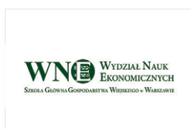
Szkoła Główna Gospodarstwa Wiejskiego w Warszawie