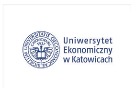
Uniwersytet Ekonomiczny w Katowicach