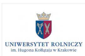
Uniwersytet Rolniczy im. Hugona Kollątaja w Krakowie