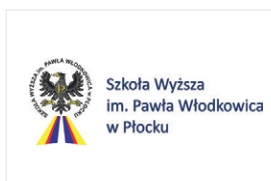
Szkoła Wyższa im. Pawła Włodkowica w Płocku