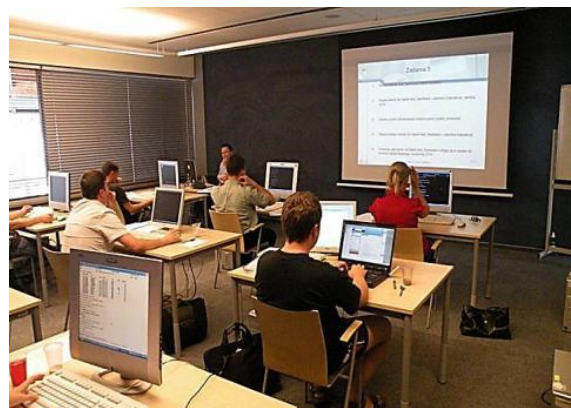
Szkolenie w Comarch Kraków

Główny ośrodek szkoleniowy Comarch mieści się w siedzibie firmy w Krakowie. Dysponujemy w nim 10 salami szkoleniowymi, przestronną restauracją w której serwowany jest lunch dla uczestników szkoleń. Przy salach szkoleniowych znajdują się specjalne wyspy na których serwowane są przerwy kawowe. Wszystkie sale szkoleniowe są klimatyzowane, w pełni wyposażone w sprzęt komputerowy niezbędny do prowadzenia szkoleń.