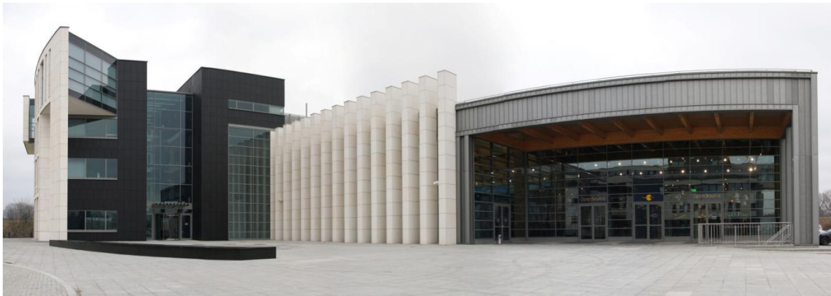
Siedziba główna Centrum Szkoleniowego w Krakowie przy ul. prof. Michała Życzkowskiego 23

Szkolenia organizowane przez Centrum Szkoleniowe Comarch odbywają się w: