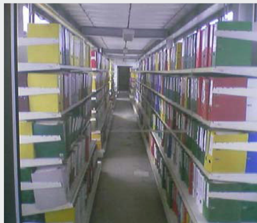
Archiwa dokumentów papierowych ACE przed wdrożeniem DMS