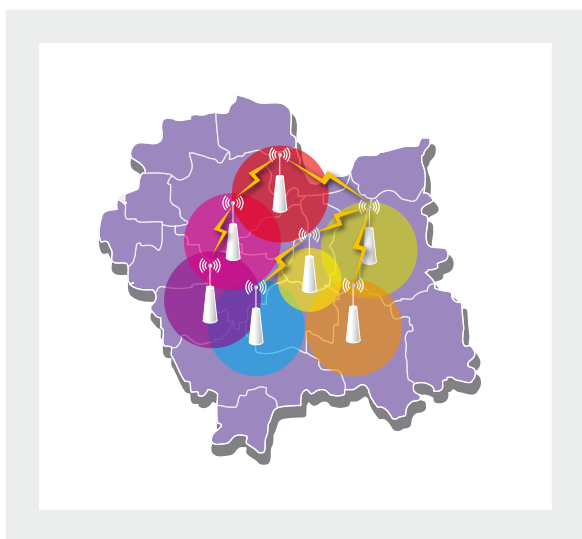
Przykładowa sieć gminna

W tak zbudowanej sieci zarówno jednostki samorządu lokalnego jak i potencjalni użytkownicy komunikować się będą z wykorzystaniem takich samych urządzeń, dlatego też bardzo ważnym elementem tego typu infrastruktury jest bezpieczeństwo. Dostępne na rynku