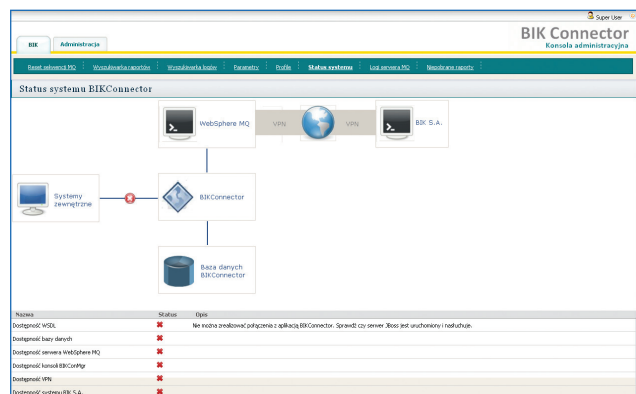
Rysunek 4: Monitoring połączenia z BIK S.A.