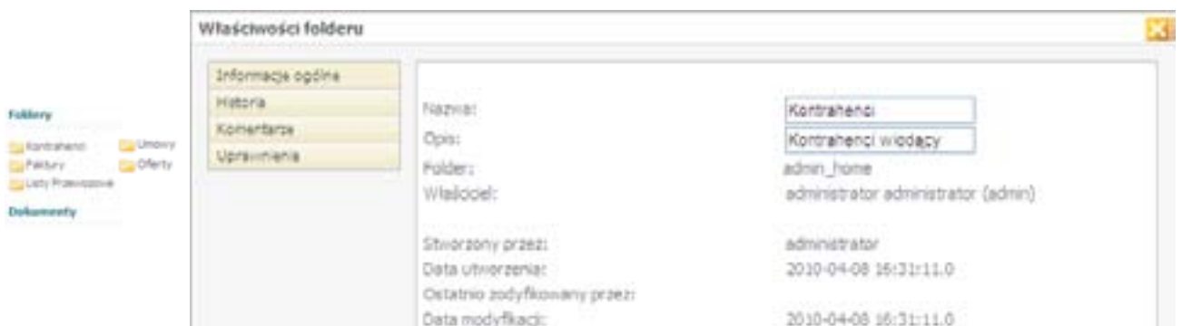
Przykładowe okna definiowania struktury i właściwości folderów

Comarch DMS Infostore wspiera tworzenie dokumentów poprzez nowoczesne mechanizmy łatwo dostępnego z poziomu przeglądarki www elektronicznego repozytorium, w którym dokumenty można swobodnie zorganizować w dowolnie rozbudowaną strukturę folderów .