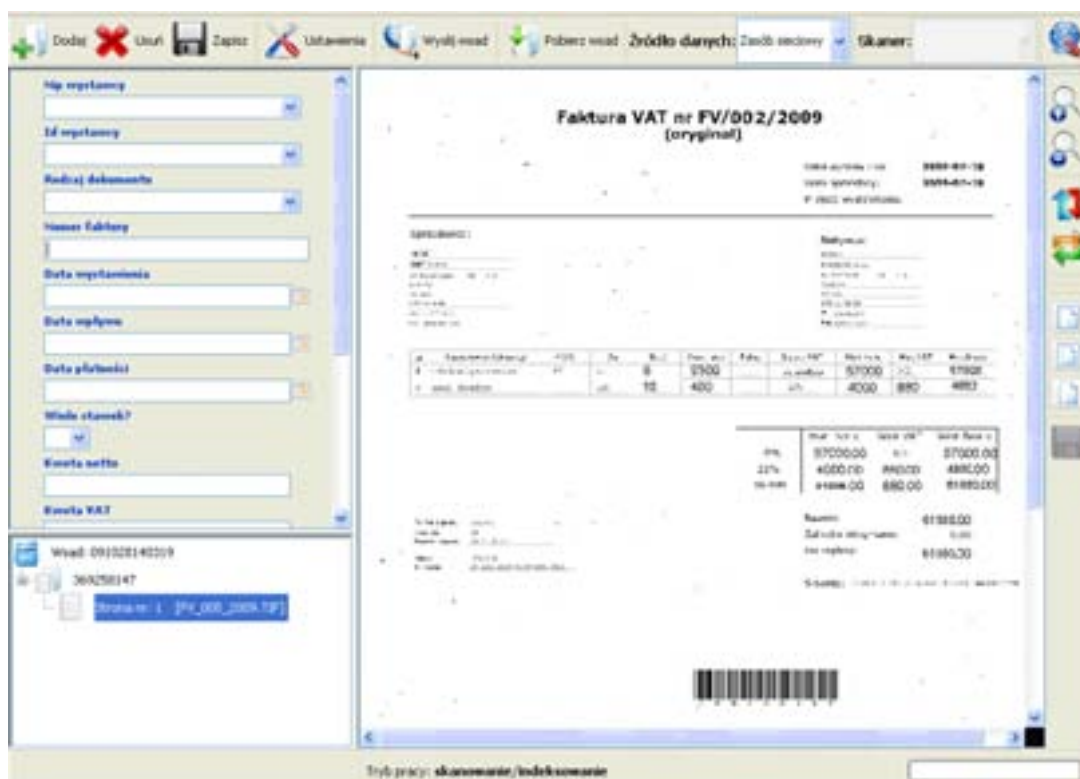
Przykładowe okno aplikacji skanującej - po lewej panel edycji metadanych dokumentu (pola indeksów).

Metadane pozwalają nie tylko skutecznie wyszukiwać dokumenty, ale i zautomatyzować ich dystrybucję , np. skierować fakturę kosztową do odpowiedniej komórki działu księgowości lub przekazać faks do handlowca obsługującego danego klienta (np. po numerze telefonu nadawcy).