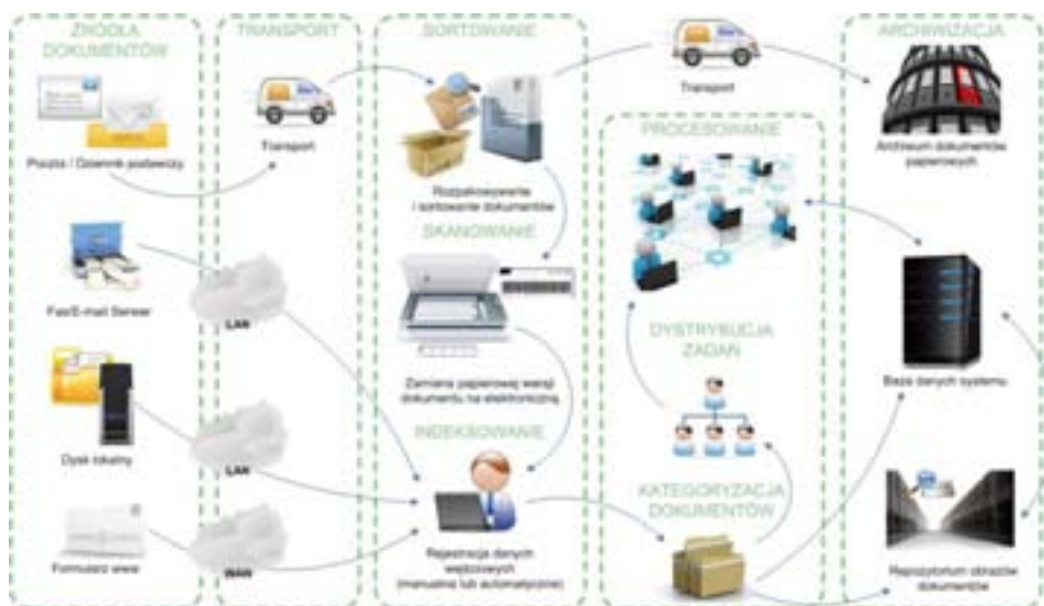
Standardowy schemat przetwarzania dokumentów w organizacji korzystającej z elektronicznego systemu do archiwizacji i zarządzania dokumentami

Dokumenty w tym kontekście należy rozumieć szeroko. Nie tylko podpisane papierowe egzemplarze, ich skany czy elektroniczne wersje edytorów tekstów, ale również faksy (papierowe i elektroniczne), emaile, obrazy, grafiki, pliki pakietów biurowych (arkusze kalkulacyjne, prezentacje), pliki narzędzi do projektowania, nagrania audio i wideo, raporty pochodzące z różnych systemów (np. ERP, billing).