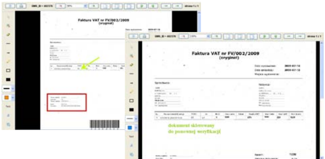
Przykładowe okna zaawansowanego podglądu obrazu dokumentu (widoczne naniesione notatki i zakreślenia)

W razie potrzeby, obraz dokumentu można podejrzeć za pomocą bardziej zaawansowanych funkcji aplikacji. Podobnie, jak w wersji prostej podglądu, obraz dokumentu wyświetlany jest nowym oknie przeglądarki www, ale zaawansowany moduł przeglądarki rozszerzony jest o narzędzia, które umożliwiają nanoszenie na obraz dodatkowych warstw z komentarzami słownymi i/lub graficznym wyróżnieniem .