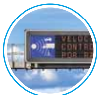
tablice zmiennej treści