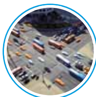
czujniki natężenia ruchu