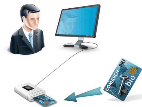
Rysunek 1. Wykorzystanie biometrii

Comarch wprowadził możliwość zastosowania biometrii powiązaniu z kartami kryptograficznymi Comarch SmartCard, co znacznie ułatwia używanie karty, gdyż użytkownik nie musi pamiętać często skomplikowanego PIN-u.