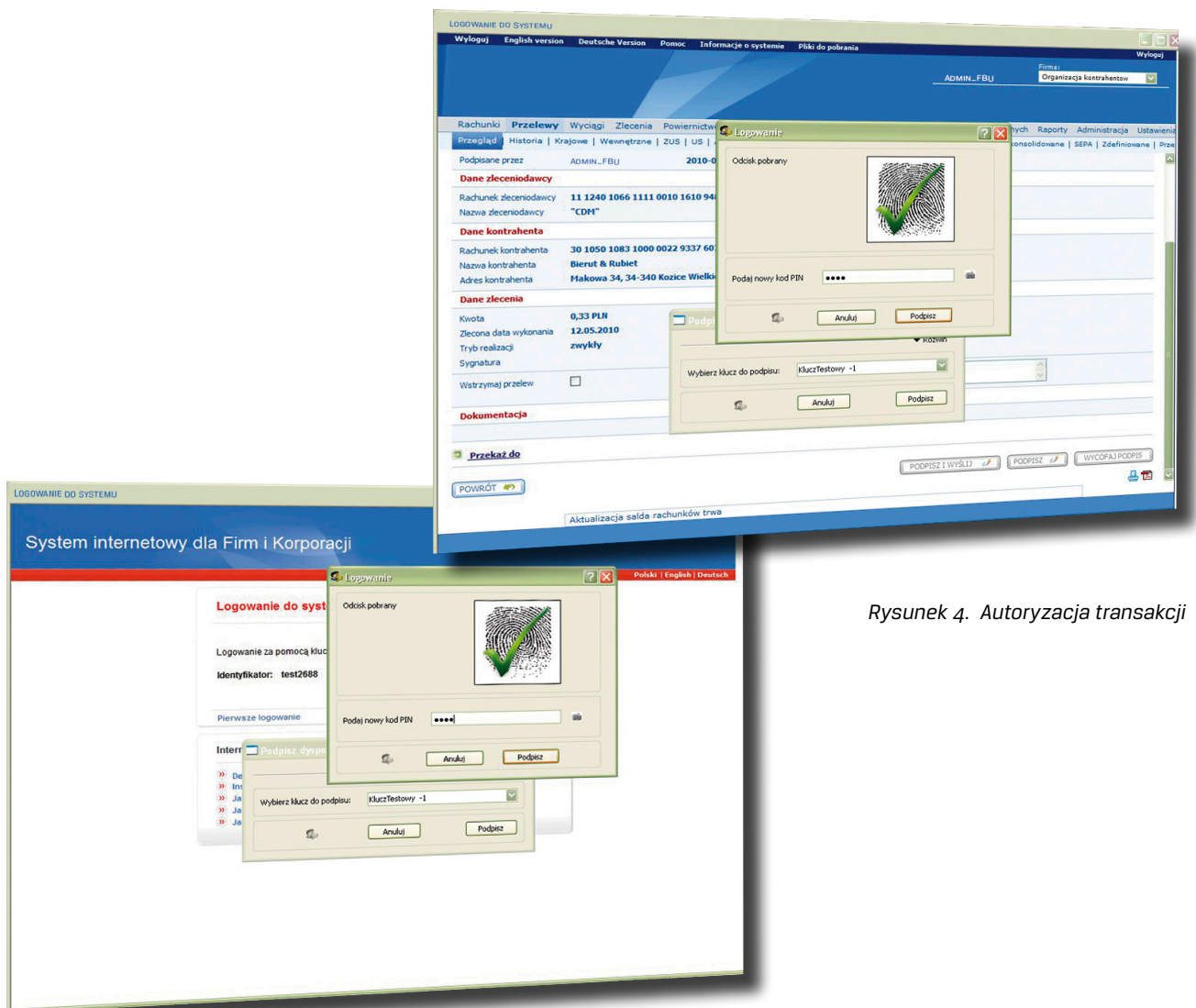
Rysunek 3. Logowanie do systemu

Jeżeli do użytkownika zostanie przypisana metoda autoryzacji i logowania z wykorzystaniem biometrii oraz PIN-u, po wprowadzeniu odcisku palca użytkownik proszony jest również o wprowadzenie PIN-u do karty. Weryfikacja odcisku palca i PIN-u zakończone powodzeniem uwierzytelniają użytkownika i umożliwiają logowanie oraz autoryzację transakcji.